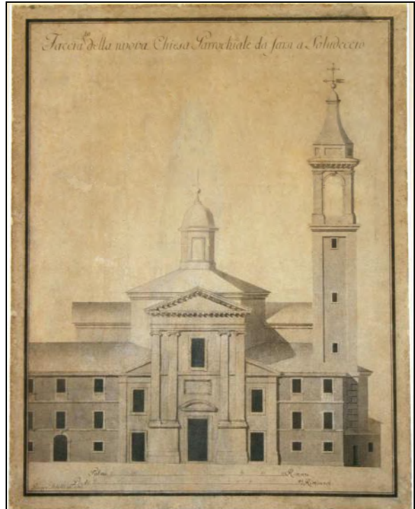
Disegno architettonico, 1794, cm 92,5 x 48, totale dopo il restauro